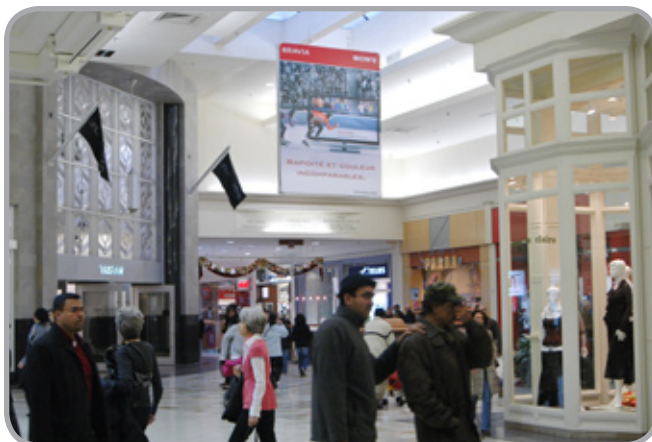
9' L X 12' H Bannières (Deux Côté)