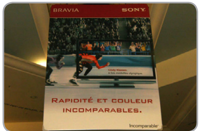
9' L X 12' H Bannières (Deux Côté)