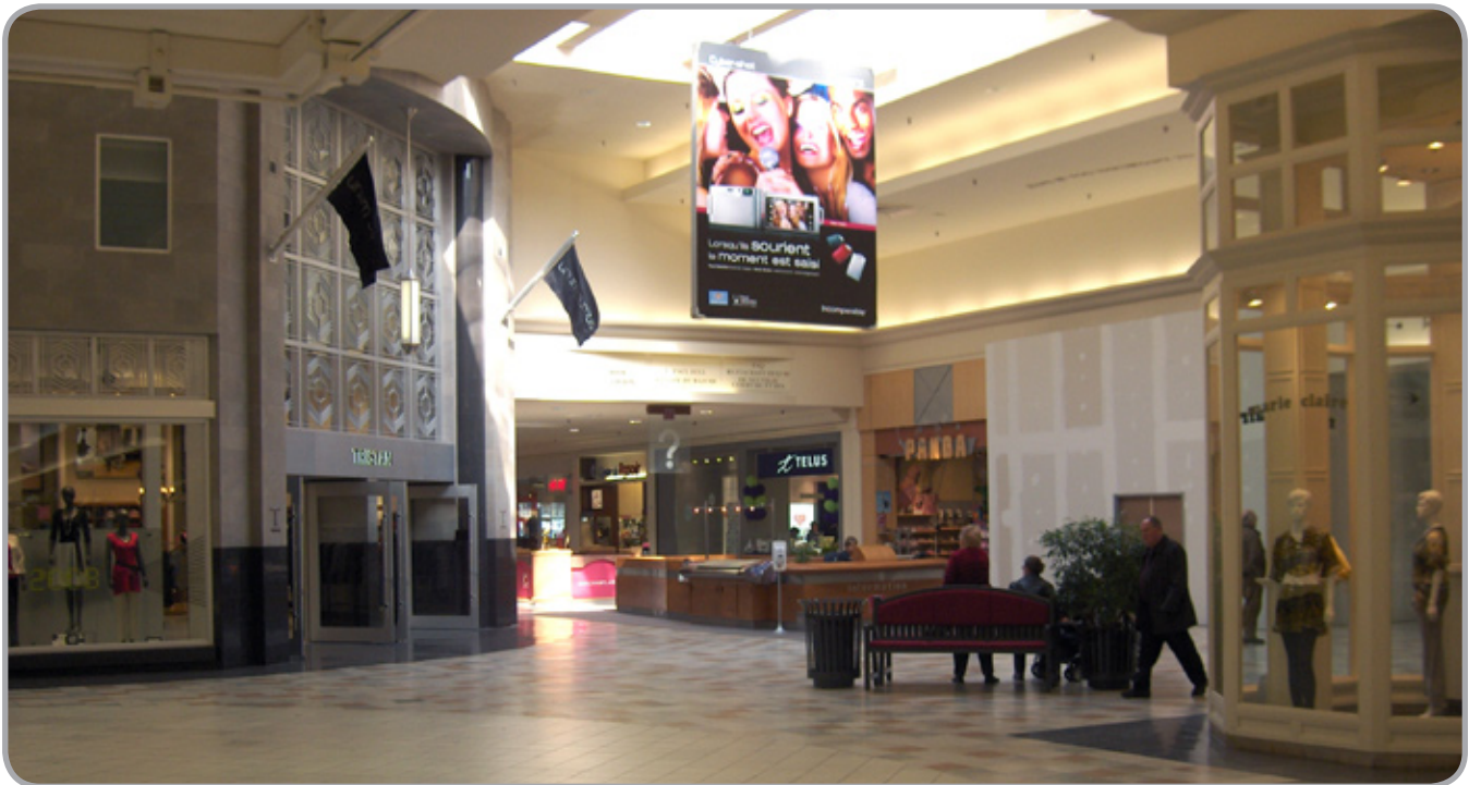
9' L X 12' H Bannières (Deux Côté)