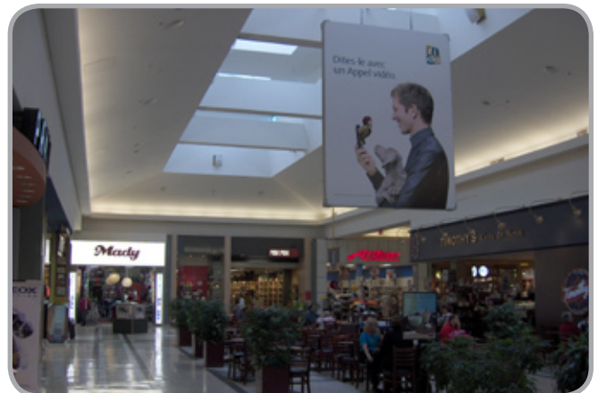
9' L X 12' H Bannières (Deux Côté)