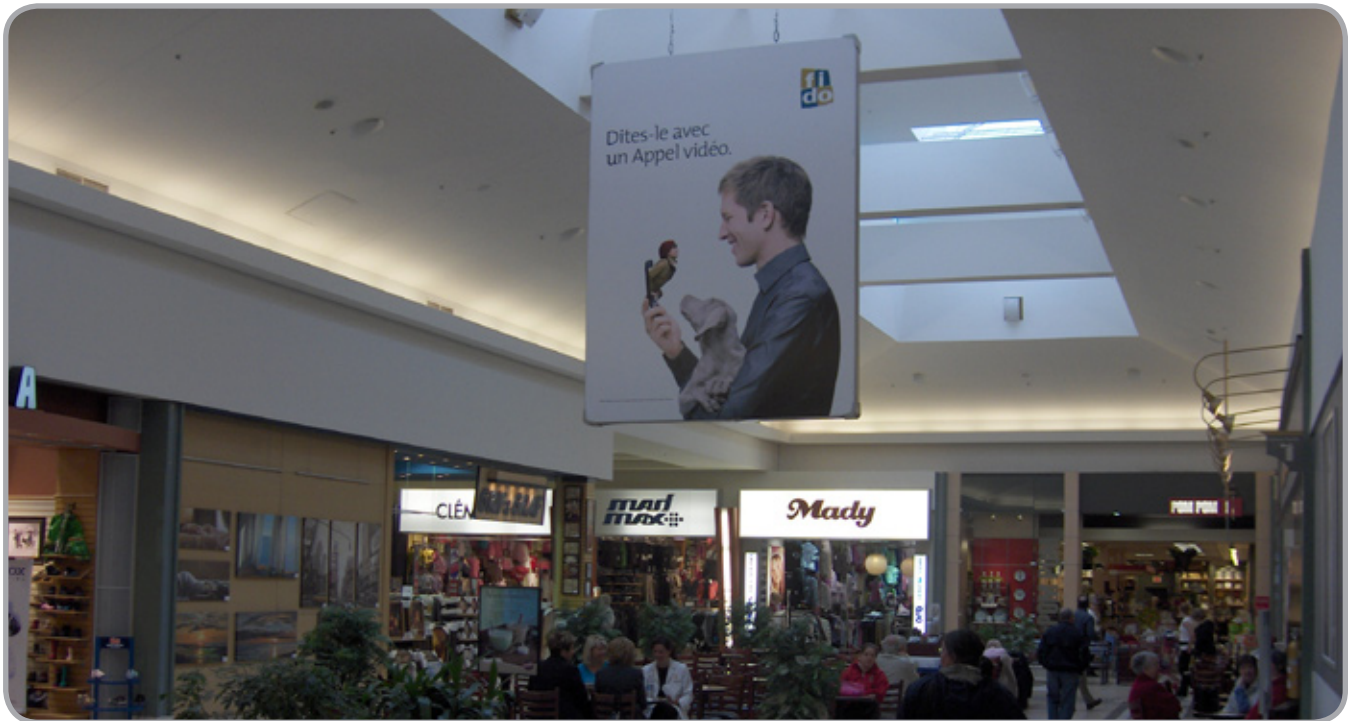
9' L X 12' H Bannières (Deux Côté)