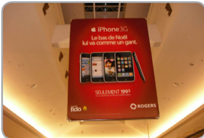
9' L X 12' H Bannières (Deux Côté)